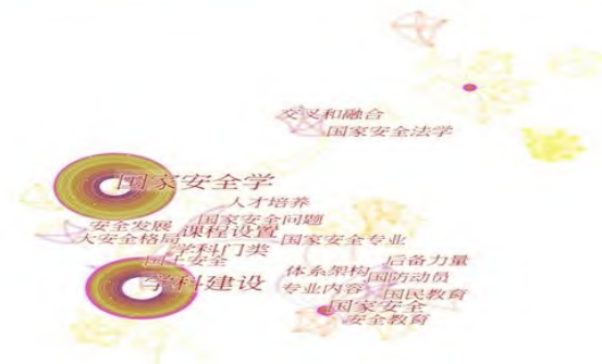
图4 1990—2022年国家安全学研究关键词共现网络

通过对有关国家安全学研究文献中的关键词使用频率进行分析,得出该研究领域内高频关键词的分布。从图4、表1可见,本领域内国家安全学作为主题检索词出现的频次最高,高达215词,中介中心性为0.30,学科建设、国家安全、学科门类、课程设置、人才培养、国家安全法学的频次分别为187、77、71、69、36、36,中介中心性分别为0.66、0.67、0.59、0.35、0.74、0.72。这表明学科建设、人才培养、课程设置等在国家安全学研究中的受关注度高。